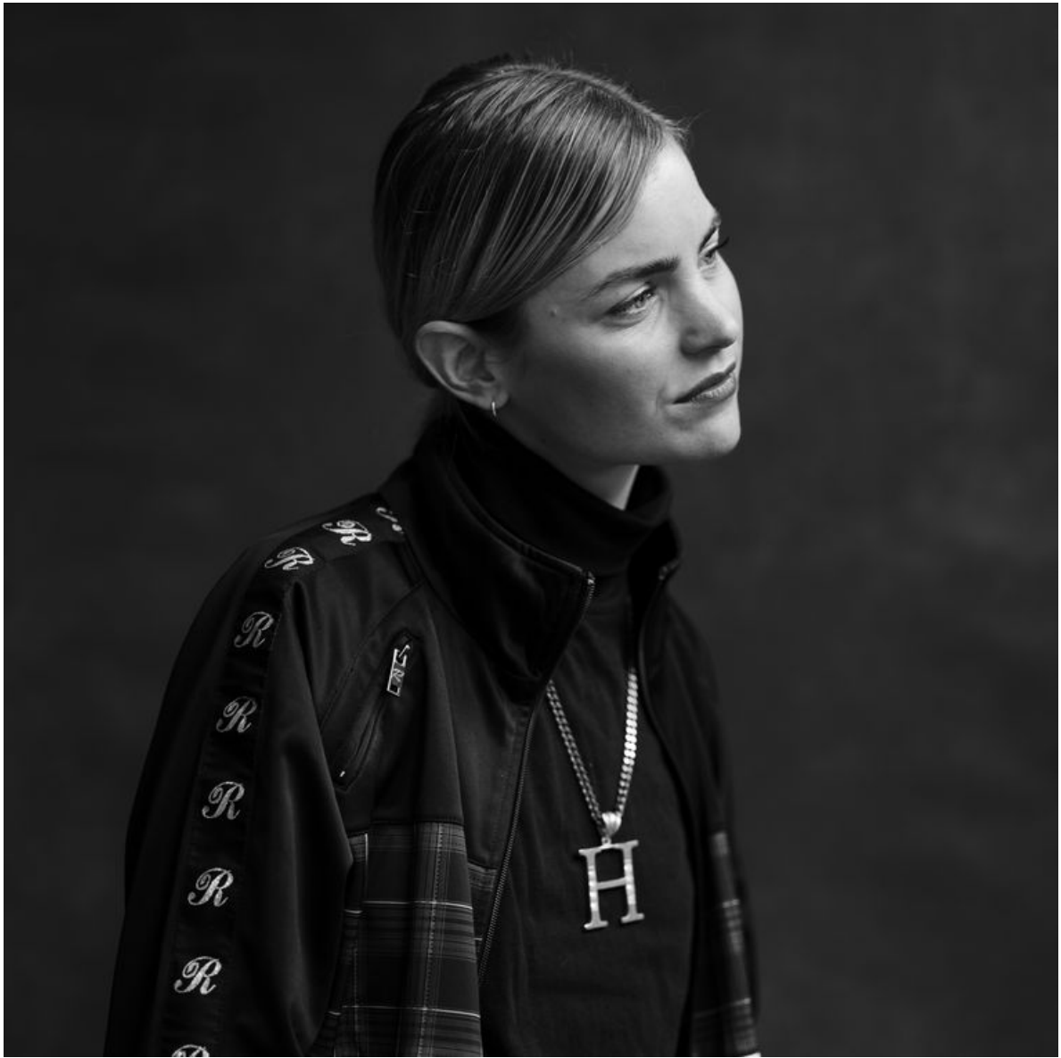
Hannah Hoekstra.